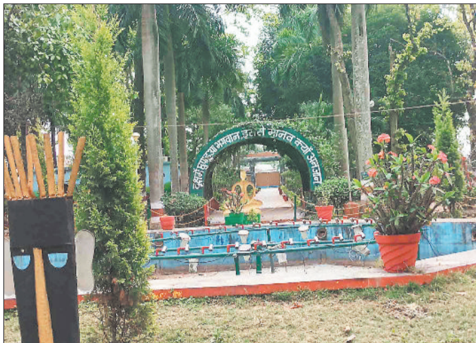
सुरी संजय वनवाटिका।

संजय वन वाटिका स्थित हिरणों के बाड़े में 20 मार्च की रात पिछले हिस्से से आवारा कुत्ते घुस गए थे तथा हमला कर 15 हिरणों को मार दिया था। पहली बार हुई इस तरह की घटना से वन अधिकारियों में हड़कंप मच गया था। मामले में वाटिका में तैनात वनकर्मियों की लापरवाही उजागर होने पर अधिकारियों ने डिटी रेंजर सहित पांच वनकर्मियों को तत्काल प्रभाव से निष्कांत कर दिया था। साथ ही आवश्यक सुधार के लिए वाटिका को तीन दिनों के लिए बंद कर दिया था। इस अप्रत्याशित घटना को लेकर विभाग की कार्याप्रणाली को लेकर भी तरह-तरह के सवाल उठे। वाटिका का सुधार कार्य पूरा होने के उपरांत गुरुवार को इसे पर्यटकों के लिए खोल दिया गया है। विभाग ने वाटिका के प्रबंधन से पूर्व में ही वन प्रबंधन समिति को पृथक कर दिया है था। अब वाटिका के प्रबंधन की जिम्मेदारी विभाग के दो अन्य कर्मचारियों को सौंपी गई है जबकि पार्क की साफ-सफाई सहित अन्य कार्यों में पूर्व के मजदूरों