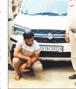
पुलिस गिरफ्तार में आरोपी।

कोरिया जिले के थाना पटना क्षेत्र में नौकरी दिलाने के नाम पर टगी करने वाले आरोपी को पुलिस ने गिरफ्तार कर न्यायालय में पेश किया है। आरोपी द्वारा आंगनबाड़ी सुपरवाइजर एवं शिक्षक पद पर नौकरी लगाने का झांसा देकर कई लोगों से लाखों रूपए टगे गए थे।