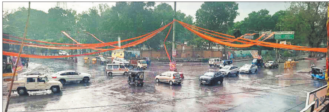
बारिश के दौरान गांधी चौक।

वर्तमान में उत्तर भारत में लगातार पछुआ विशोभ सक्रिय है। पूर्व में सक्रिय विशोभ का प्रभाव अभी खत्म भी नहीं हुआ है कि गुरुवार को एक नया ताकतवर विशोभ सक्रिय हो गया है जबकि एक अन्य पछुआ विशोभ के शुक्रवार को देर रात तक सक्रिय होने की संभावना है। विशोभ के प्रभाव से पश्चिम बंगलादेश, उत्तर-पश्चिम बिहार, मणिपुर आसाम में चक्रवाती परिस्वरण वहीं मराठवाड़ा से कर्नाटक